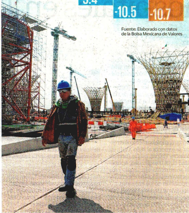
Trabajadores de la obra en Texcoco aún llevan a cabo sus labores de forma cotidiana; sin embargo, dicen estar preocupados por buscar otro empleo. A8