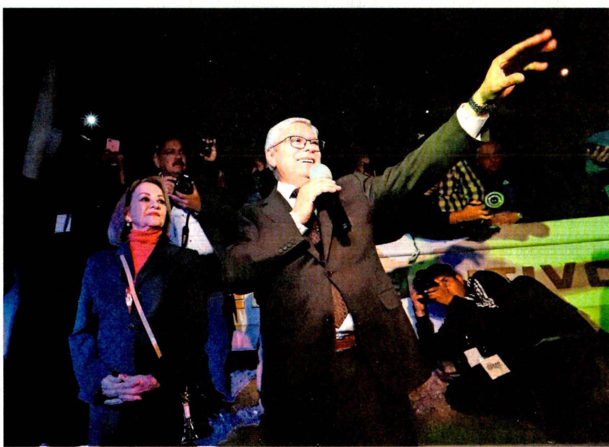
Entre alardes y saludos de mano, Bonilla arribó al Congreso local para tomar posesión como gobernador de BC.