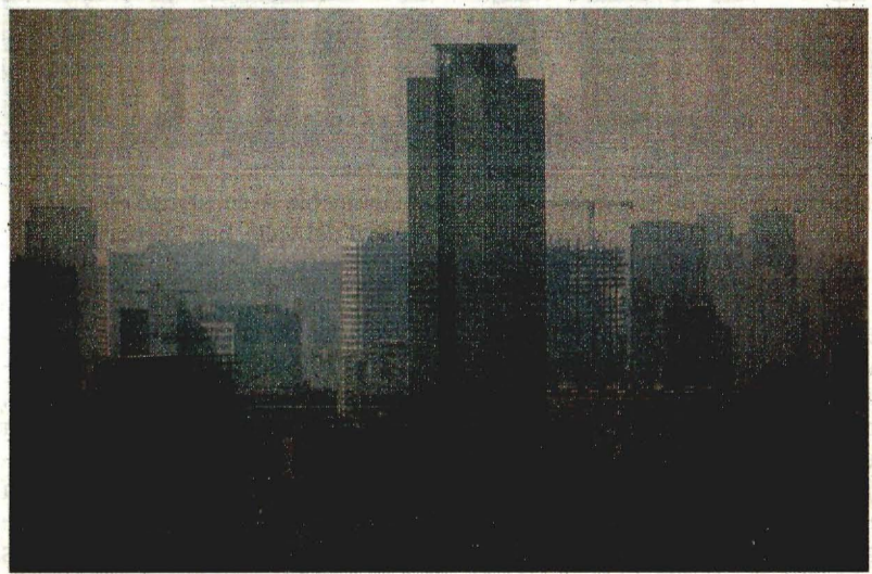
El inicio de año para la Ciudad de México fue gris por los altos índices de contaminantes registrados ayer, que se prevé continuarán en enero.