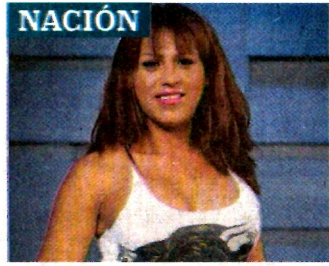
NACIÓN CAMILA MATA. EL UNIVERSAL