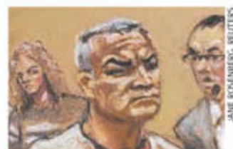
JANE KOHNBERG, REUTERS