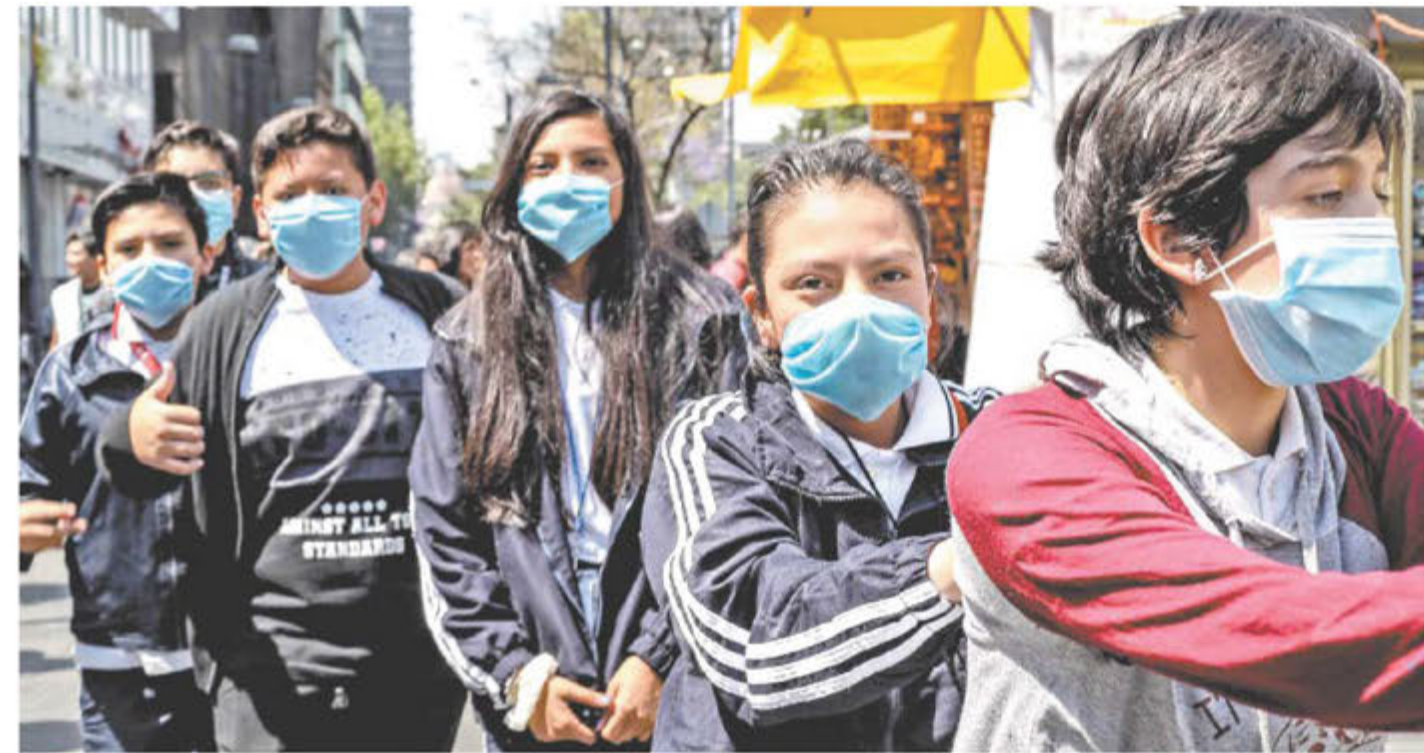
GERMÁN ESPINOSA, EL UNIVERSAL