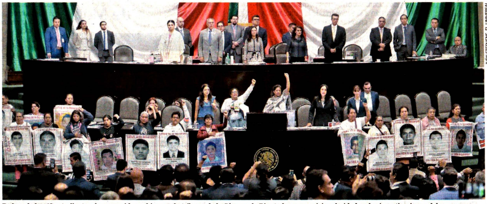
Padres de los 43 estudiantes desaparecidos subieron a la tribuna de la Cámara de Diputados para exigir celeridad en las investigaciones del caso.

● La Junta de Gobierno del organismo tomó la decisión de reducir el costo del dinero en 25 puntos base, a 7.75%, ante el entorno actual de riesgos. A31