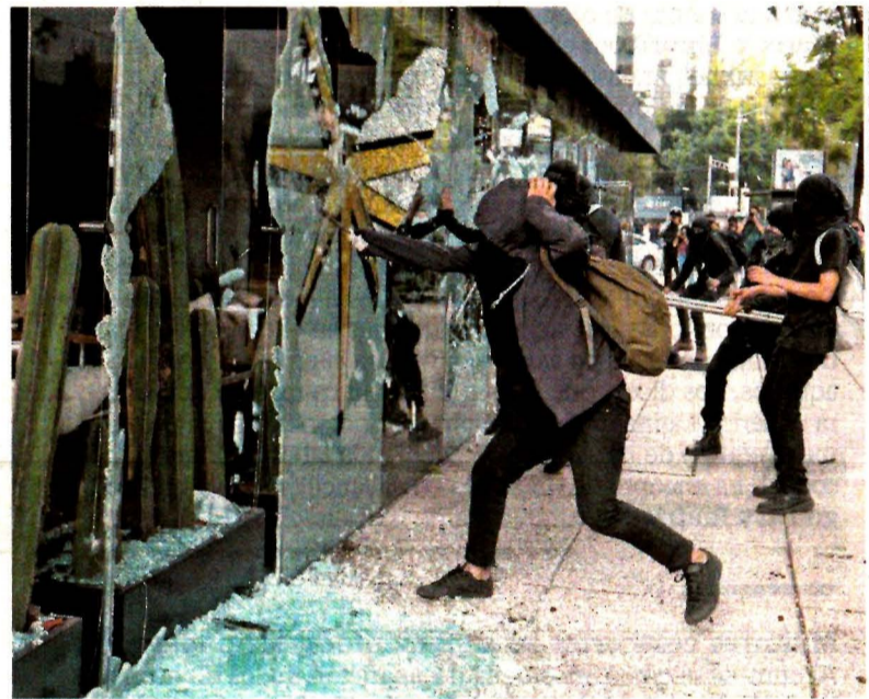
Un grupo de anarquistas causaron destrozos a negocios ubicados en la ruta de la marcha del Ángel de la Independencia al Zócalo. METRÓPOLI A22