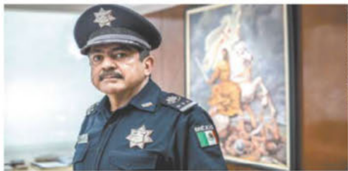
GERMÁN ESPINOSA, EL UNIVERSAL

“Viene una etapa más ruda de inseguridad después de la epidemia”