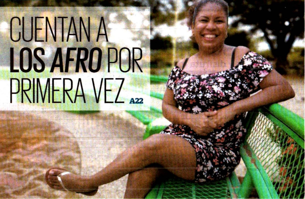
ROSELIA CHACA, EL UNIVERSAL