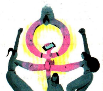
DANTE DE LA VEGA, EL UNIVERSAL

● Ante la ola de violencia en la Ciudad de México, crean chats para monitorear situaciones de riesgo y emergencia las 24 horas. A20