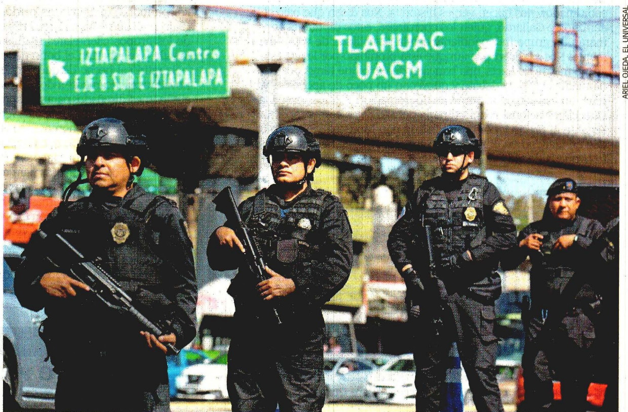
Policías de élite instalaron dos retenes sobre avenida Tláhuac, en la zona de Iztapalapa donde se registró el multihomicidio del pasado domingo. Revisan que los automovilistas no porten armas ni trasladen drogas.