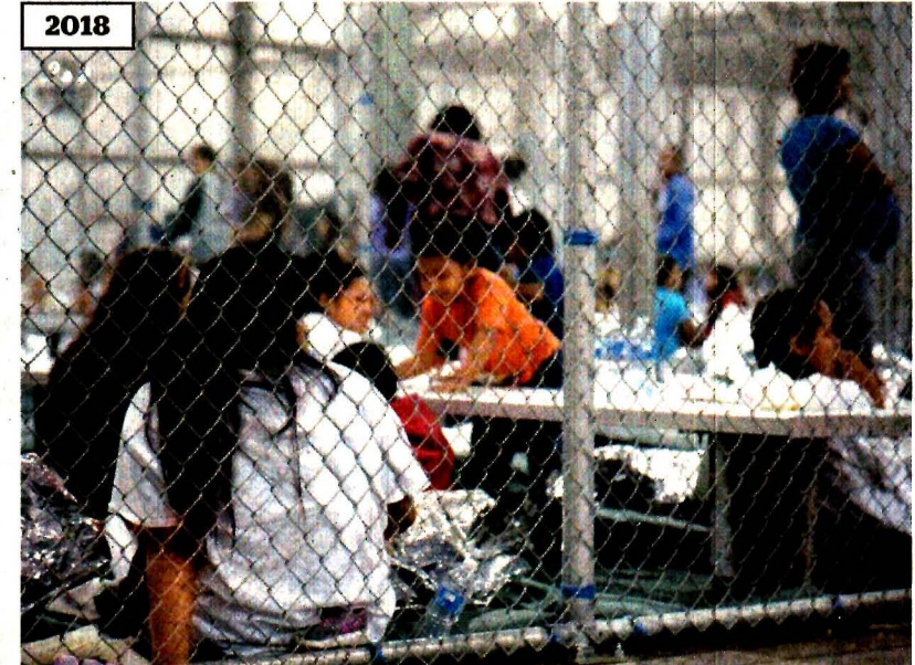
Los niños detenidos por cruzar la frontera permanecen dentro de jaulas en un centro de detenciones de McAllen, Texas.