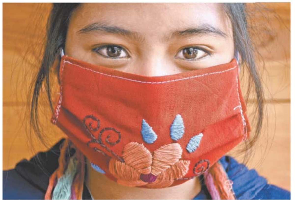
Las artesanas chiapanecas tardan un promedio de dos horas en elaborar un cubrebocas bordado.