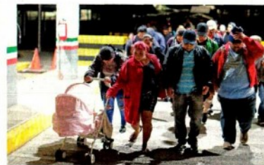
Integrantes de la caravana migrante ingresaron a México a las 4:00 horas de ayer, a través del Puente Internacional Rodolfo Robles. ESTADOS A12

MARÍA DE JESÚS PETERS Corresponsal —estados@eluniversal.com.mx