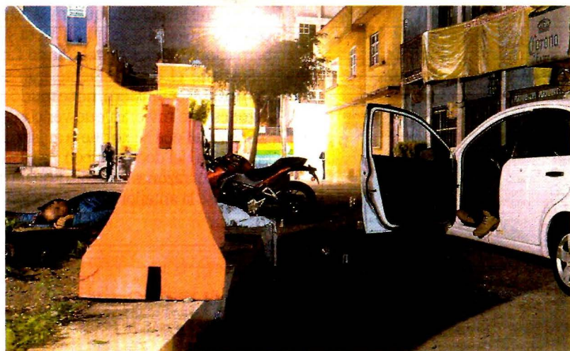
Las víctimas convivían frente a la iglesia del pueblo de Culhuacán, en la alcaldía Iztapalapa, cuando un grupo armado las atacó.

Claudia Sheinbaum, jefa de Gobierno, afirmó que "la Secretaría de