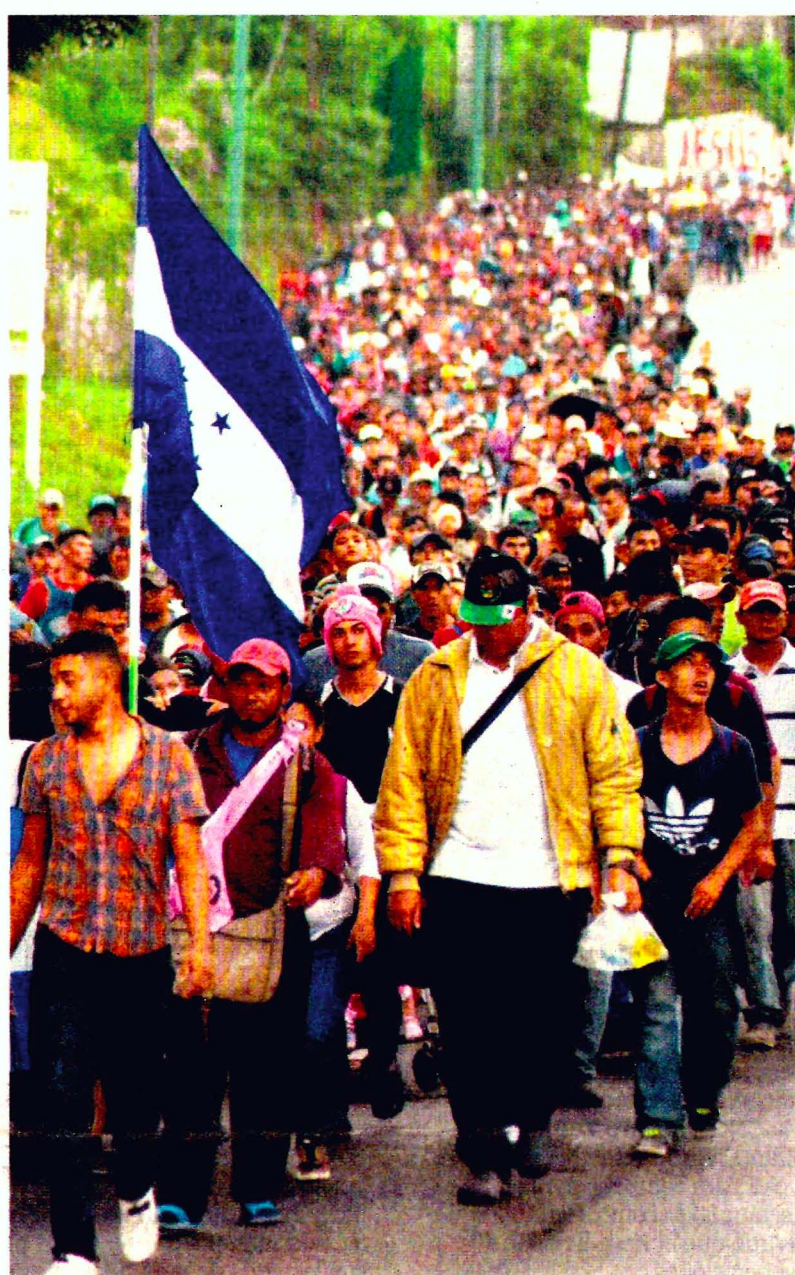
Miles de migrantes hondureños cumplieron ayer su segunda jornada de camino por Guatemala en su ruta hacia Estados Unidos.

Aumentado poco 18% Disminuido poco 5.9% Disminuido mucho 0.6% No sabe/No contestó 3.5%