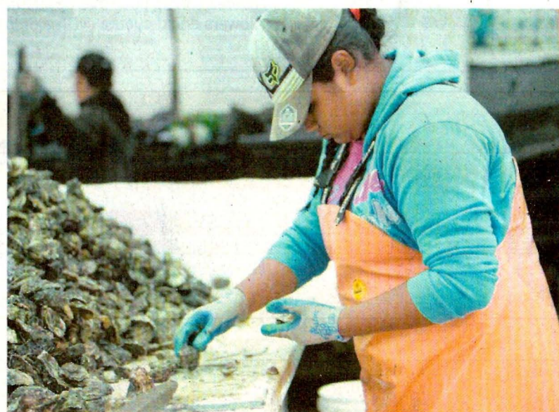
Una mujer trabaja en una planta de procesamiento de ostras y otros productos acuícolas en Guerrero Negro, Baja California Sur.