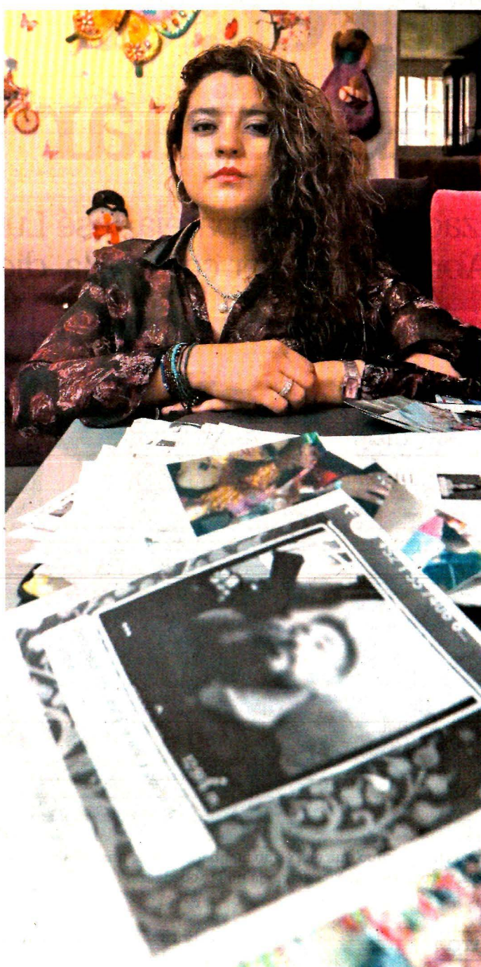
Liliana tiene capturas de pantalla de los mensajes que le envía su expareja para amenazarla de muerte.