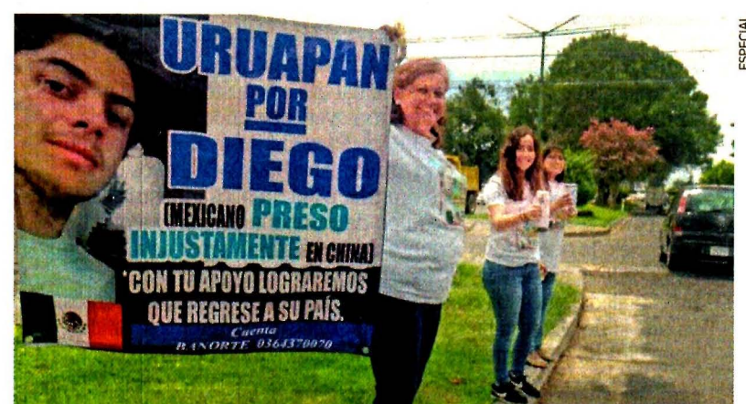
Mediante boteo se logró reunir la cantidad establecida para otorgar el perdón a Diego, acusado de golpear a una persona de la tercera edad.

CARLOS ARRIETA Corresponsal —estados@eluniversal.com.mx