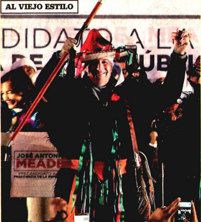
José Antonio Meade reunió a cientos de personas y recibió el bastón de mando en San Juan Chamula.