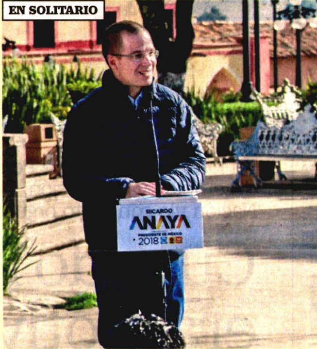
Ricardo Anaya arrancó la búsqueda del voto en Querétaro con un acto que tuvo poca asistencia de sus adeptos.