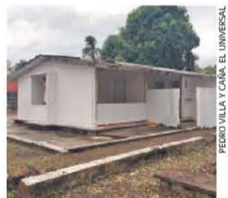
El inmueble está deteriorado, con el techo a punto de colapsar.