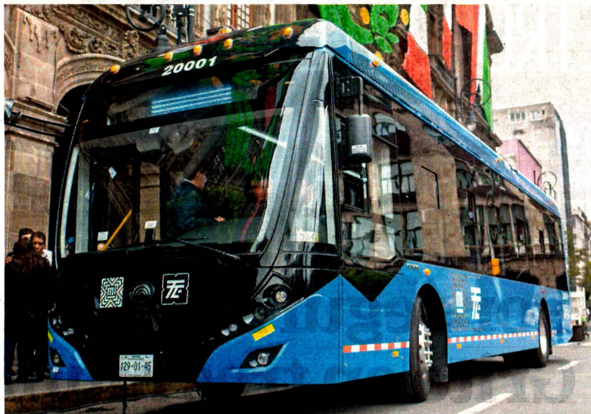
Las nuevas unidades del trolebús tienen capacidad para 85 pasajeros, además de un sistema de recuperación de energía. Cuentan también con seis cámaras de videovigilancia en el interior, el frente y atrás de cada colectivo.

prácticamente están yendo hacia el transporte eléctrico.