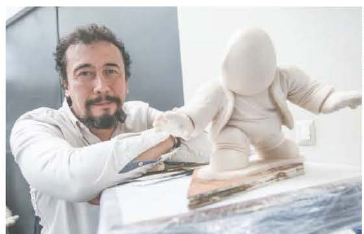
El artista Rodrigo de la Sierra denunció que la venta de piezas falsas de sus obras a bajo costo por internet se ha disparado en los últimos años.

● El gobierno federal anunció que la venta de boletos iniciará el 9 de marzo, fecha en que las mujeres realizarán #UnDía SinNosotras. A4