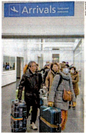
Viajeros chinos en Finlandia usan cubrebocas como medida de prevención contra el virus.

● El Gobierno invertirá 64 millones de pesos en una estrategia de atención integral a los jóvenes, mejoras a centros de prevención y más especialistas. El proyecto arrancará operaciones en marzo próximo. A13