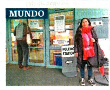
INDER BUCARIN, EL UNIVERSAL

GRAN NOCHE MAVERICKS PRENDEN A LA ARENA CIUDAD DE MÉXICO Y SE IMPONEN 122-111 A PISTONS. B7