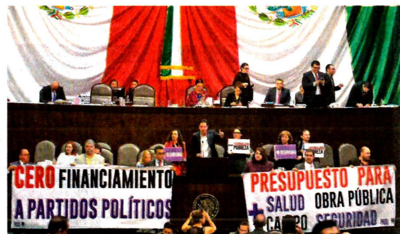
Mantas con los posicionamientos de diputados, en la discusión del recorte de 50% a los recursos destinados para los partidos políticos.