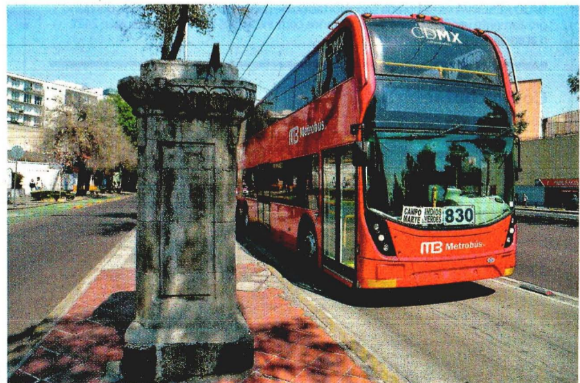
A lo largo de Paseo de la Reforma se aprecian los pedestales vacíos y vandalizados, otros presentan falta de mantenimiento.