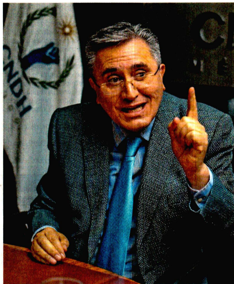
GERMÁN ESPINOSA. EL UNIVERSAL

A punto de concluir su encargo al frente de la CNDH, dice que se va “muy insatisfecho” por no tener el 100% de cumplimiento de las recomendaciones, por las 40 mil desapariciones, por la grave violencia contra las mujeres y por las agresiones contra los periodistas y de-