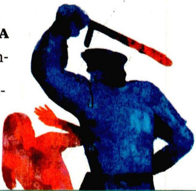
ILUSTRACIÓN: DANTE DE LA VEGA