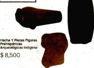
Hacha y Piezas Figuras Prehispánicas Arqueológicas Indígena $ 8,500