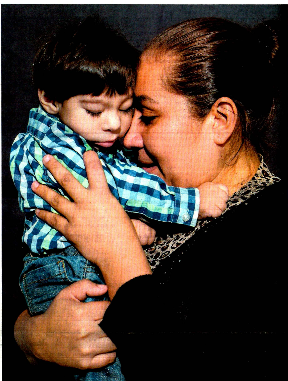
YADIN XOLAUPA, EL UNIVERSAL