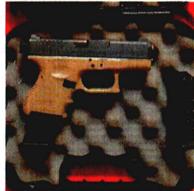
Las armas cortas llegan a venderse en 35 mil pesos al público.