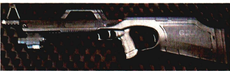
Armas como el rifle semiautomático Walther G22 llegan a Tepito.

EL UNIVERSAL recorrió la colonia Morelos y pudo llegar con un hombre que, dice, fue policía de la Ciudad de México y se hace llamar El Nengo , quien desde hace seis años se dedica a traficar armas.