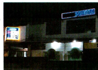
6 de septiembre de 2006 Las cabezas de cinco personas fueron tiradas en el centro nocturno Sol y Sombra de la ciudad de Uruapan.

Morelia, Mich.— La madrugada del 6 de septiembre de 2006 cerca de 20 hombres irrumpieron en el bar Sol y Sombra de Uruapan, Michoacán; dispararon al techo, amenazaron a los presentes y vaciaron sus bolsas negras de plástico en la pista de baile. El contenido: cinco cabezas humanas.