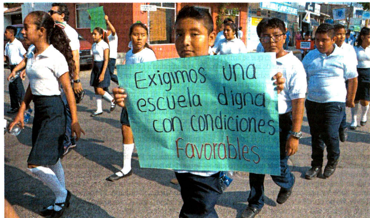
Con pancartas, niños desfilaron ayer en Juchitán, Oaxaca, para exigir la reconstrucción total de sus escuelas, ya que las obras están inconclusas y, a dos años de los sismos, continúan recibiendo clases en carpas. A27