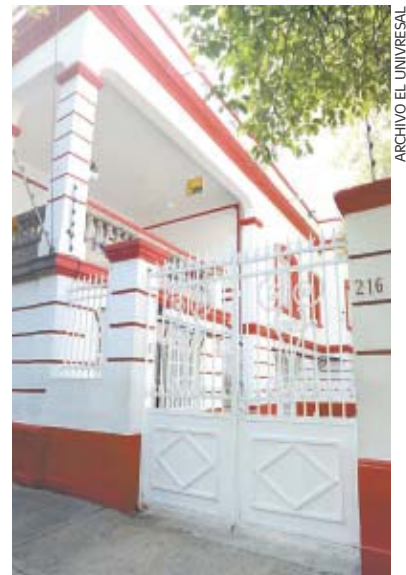
La casaca se ubica en Chihuahua 216, colonia Roma, en la CDMX.