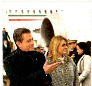
El Presidente y su esposa llegaron al aeropuerto Charles de Gaulle.

Fuente: Encuesta de EL UNIVERSAL/Buendía & Laredo