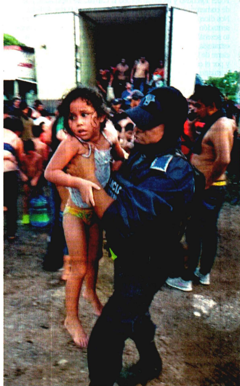
Los migrantes rescatados, entre los que se encontraron 71 niños, presentaban signos de deshidratación.

● Fueron hallados en Veracruz; en Tapachula, cierran albergue migratorio