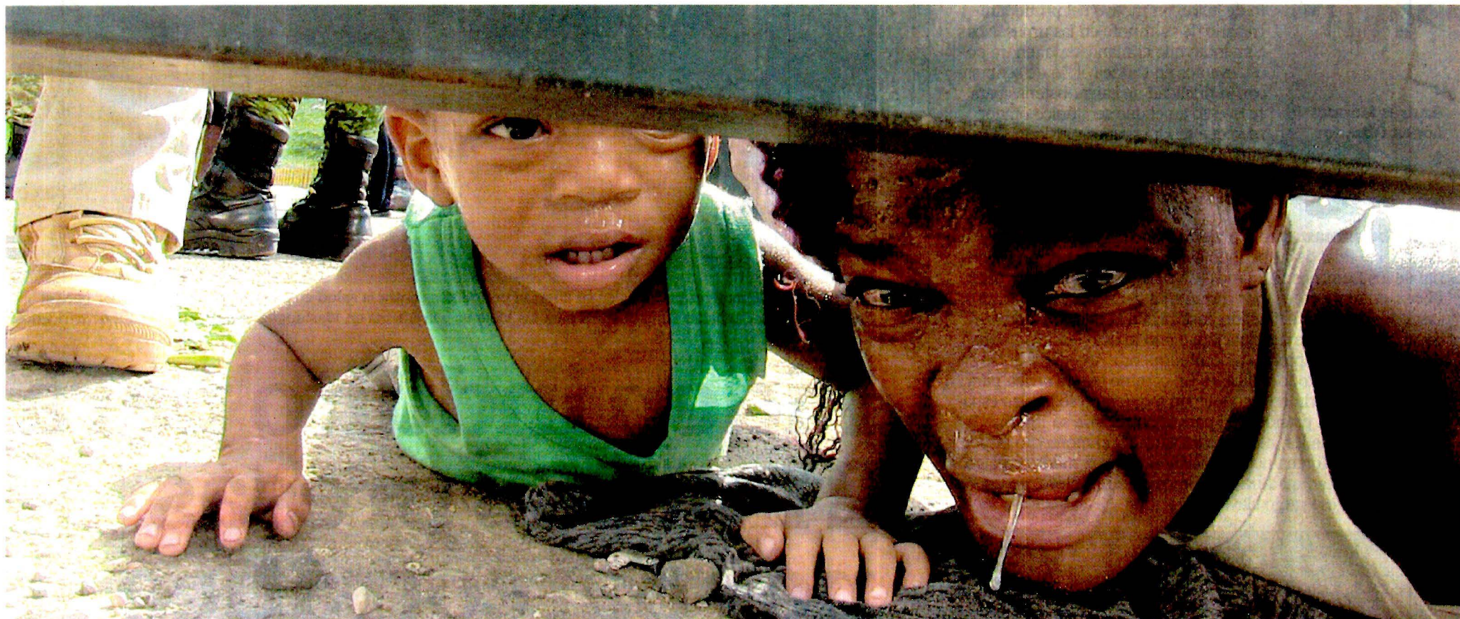
En un centro de detención del INM en Tapachula, Fabiola, procedente de Haití, clamaba por debajo del portón por ayuda para su hijo enfermo.

MARÍA DE JESÚS PETERS Y ÓSCAR GUTIÉRREZ Corresponsales