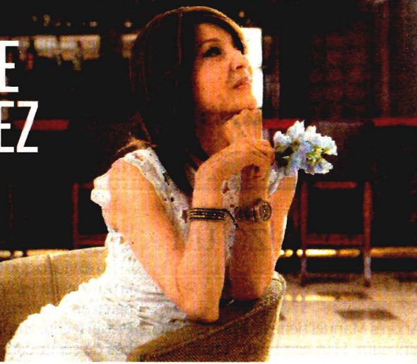
GERMAN ESPINOSA. ARCHIVO EL UNIVERSAL

LA ACTRIZ FALLECIÓ AYER TRAS UNA RECAÍDA POR CÁNCER, ENFERMEDAD QUE NUNCA DOBLEGÓ SU ESPÍRITU. DEJA UN LEGADO DE PROFESIONALISMO Y LUCHA. C1 y C2