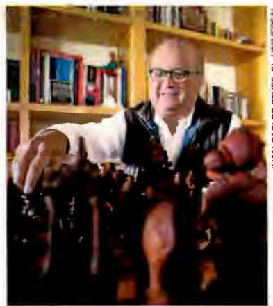
JUAN CARLOS REYES, EL UNIVERSAL

En entrevista con EL UNIVERSAL, considera que Silvano Aureo-