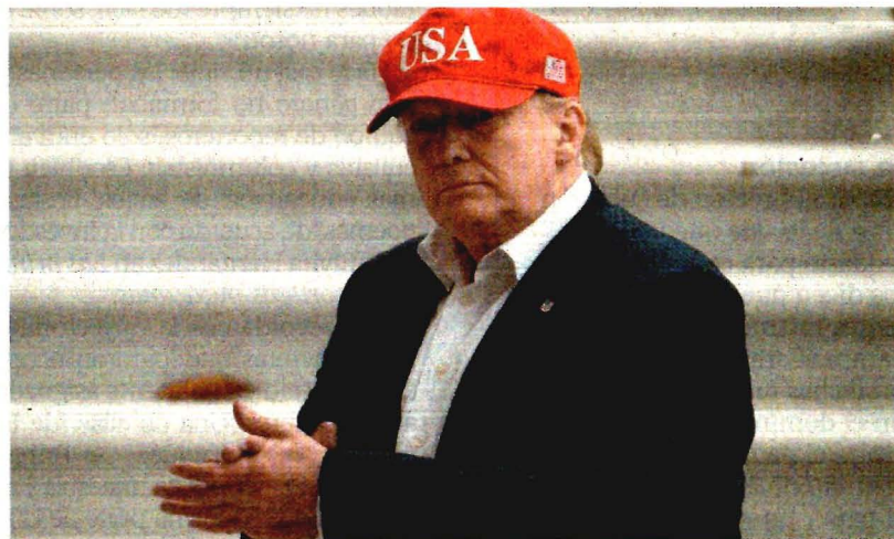
El presidente Donald Trump regresó ayer a Estados Unidos, luego de un viaje a Europa. Dijo que el acuerdo con México es reducir la inmigración ilegal.

El canciller mexicano, Marcelo Ebrard, detalló que entre los principales puntos del acuerdo están que los migrantes que crucen hacia Estados Unidos para pedir asilo serán retornados sin demora a México, en donde podrán esperar sobre sus solicitudes, se les autorizará la entrada y se les ofrecerán oportunidades laborales y acceso a la salud. La Guardia Nacional tendrá prioridad en 11