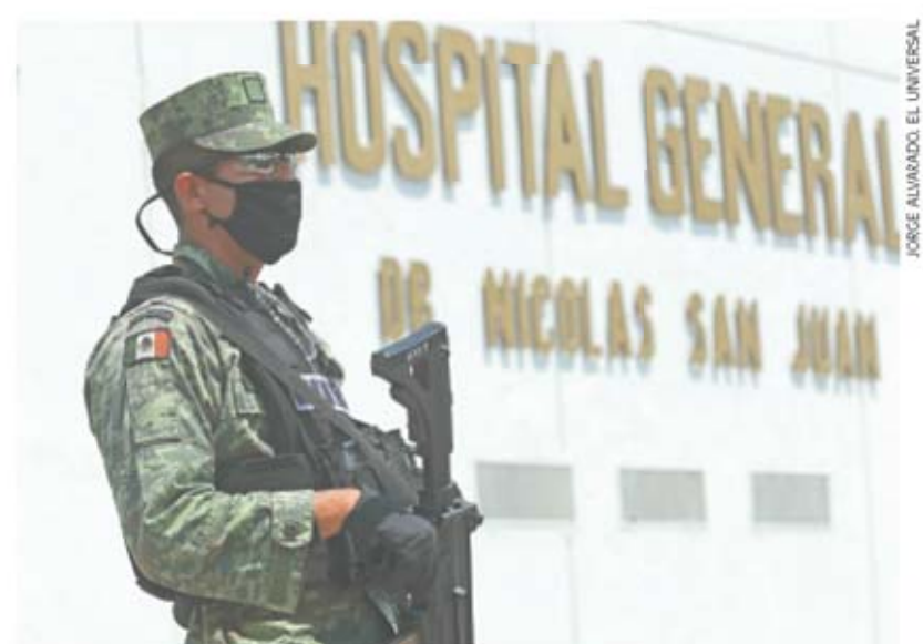
Elementos de la Guardia Nacional resguardan los hospitales que atienden a pacientes con coronavirus en el Estado de México.