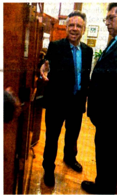
PEDRO VILLA Y CAÑA. EL UNIVERSAL

López Obrador dijo: "He dado instrucciones a todos los servidores que conociendo de estos hechos de inmediato se turnen a la Fiscalía, que no nos quedemos con nada".