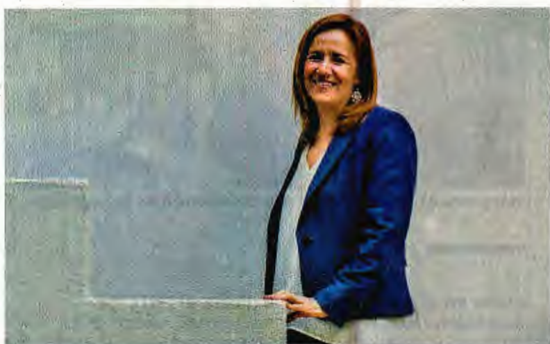
La aspirante presidencial Margarita Zavala anunció que hoy a las 14:00 horas emite un pronunciamiento sobre la versión de su salida del PAN.