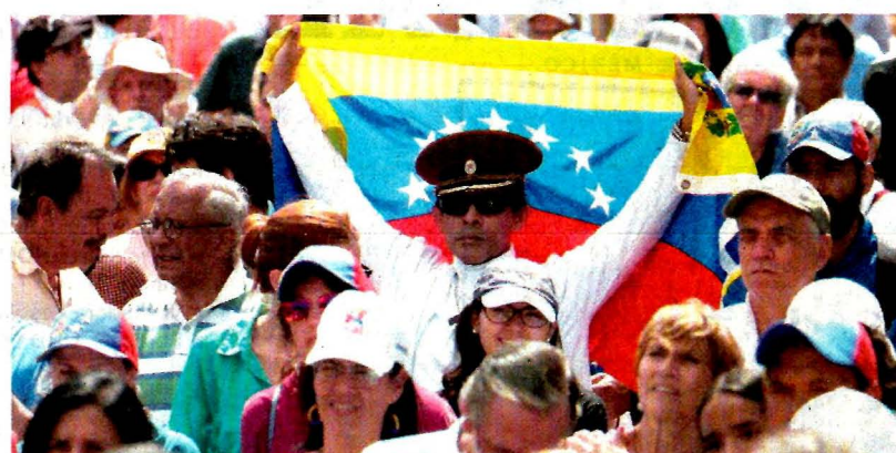
Simpatizantes de Guaidó, durante un mitín realizado ayer en Caracas.

● Juan Guaidó, un joven político venezolano, lanzó el desafío al autoproclamarse presidente encargado y declarar “usurpador” al mandatario. Varios países, incluyendo Estados Unidos, lo respaldan y reclaman elecciones libres en el país sudamericano. Sin embargo, Nicolás Maduro tiene de su lado a Rusia, China y al ejército, que al final puede inclinar la balanza. A15