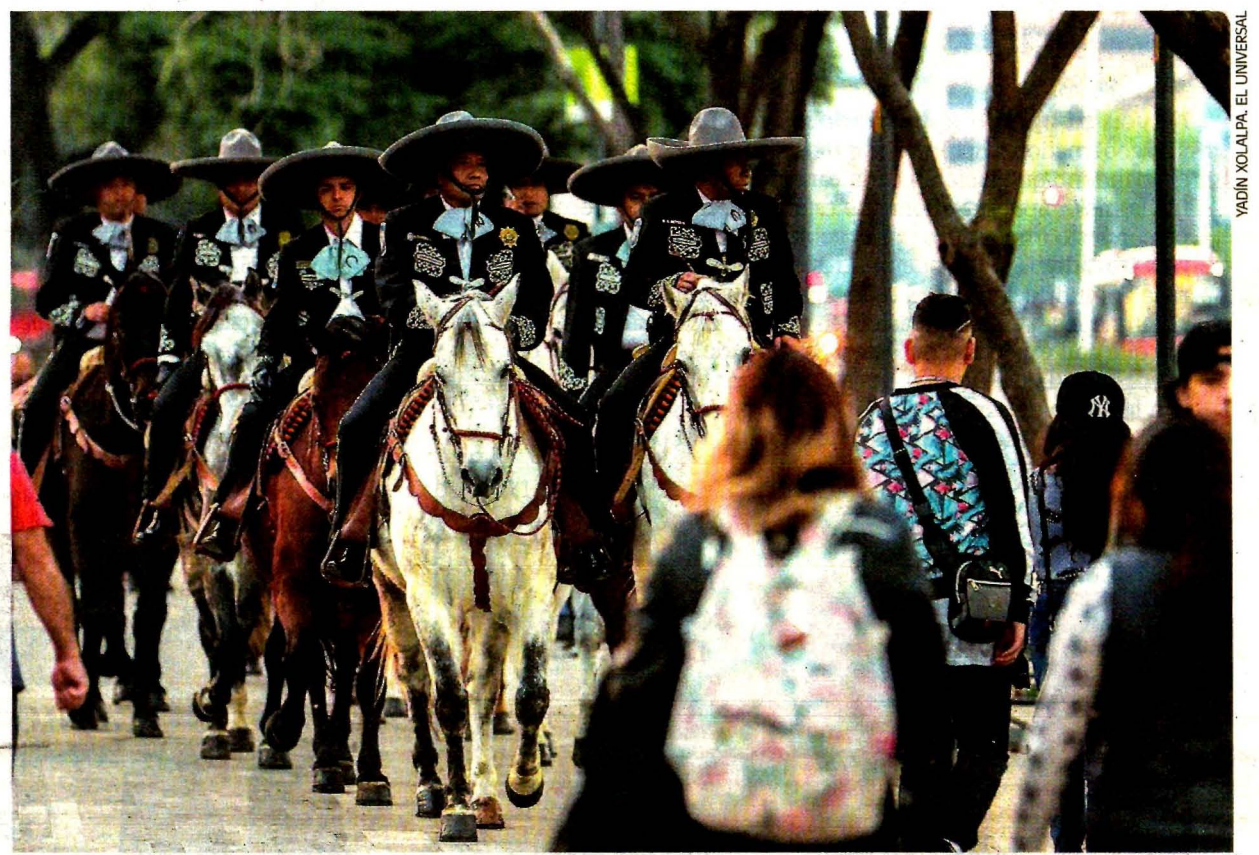
A partir de ayer, 30 policías a caballo regresaron a vigilar las inmediaciones de la Alameda Central tras seis años de haber desaparecido como agrupación. Entre sus tareas está dar información a paseantes nacionales y extranjeros.