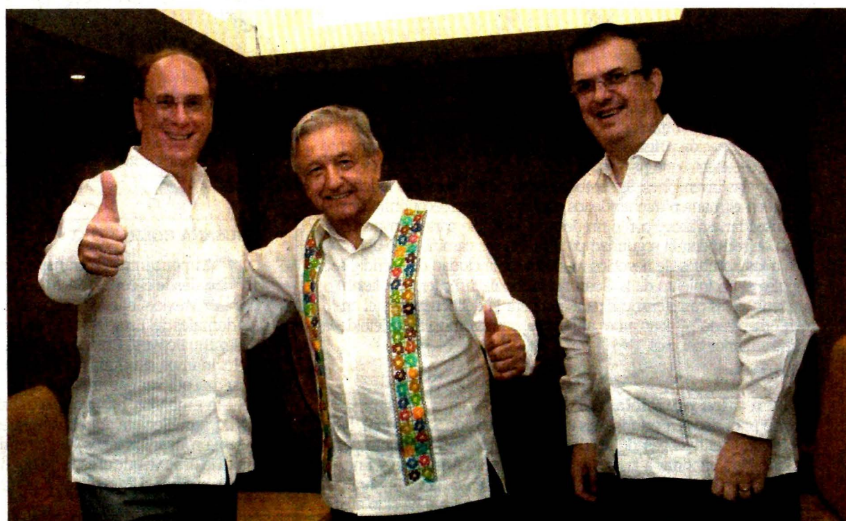
Larry Fink, consejero delegado de BlackRock, el presidente Andrés Manuel López Obrador y el canciller Marcèlo Ebrard durante la reunión de empresarios de México y Estados Unidos.