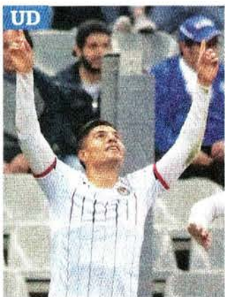
CARLOS MEJÍA, EL UNIVERSAL