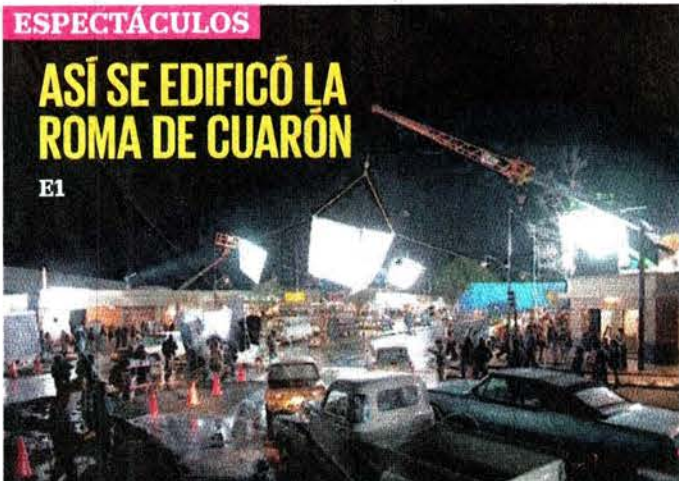
CORTESÍA EUGENIO CABALLERO