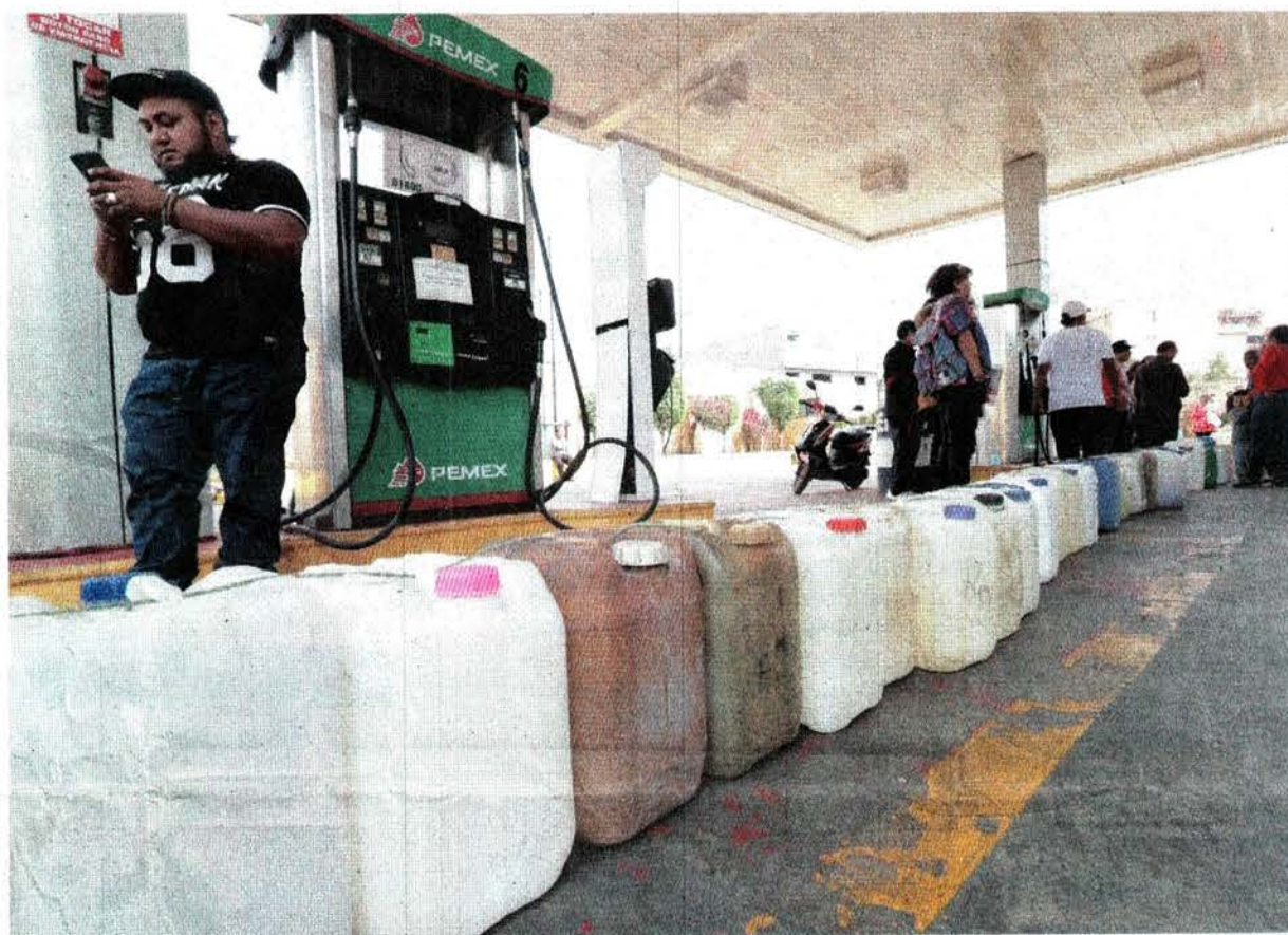
LUIS CORTÉS, EL UNIVERSAL