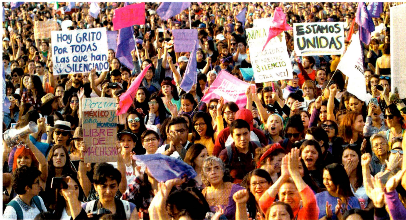
Miles de mujeres marcharon ayer en la Ciudad de México para exigir un alto a los feminicidios y a los intentos de secuestro denunciados en el Metro.

● “Ni una más”, dicen durante marcha para exigir seguridad ● Usuaris del Metro piden sensibilizar a los policías