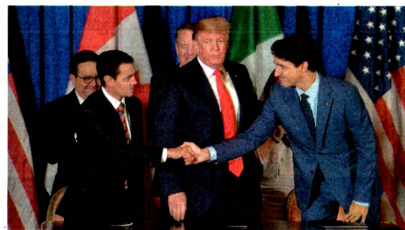
Enrique Peña Nieto, Donald Trump y Justin Trudeau, en la firma del acuerdo comercial entre México, EU y Canadá, durante la cumbre del G20, en Argentina.

Peña dijo que los tratados necesitan avanzar “de acuerdo con los cambios