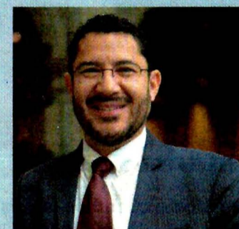
Martí Batres tiene cercanía ideológica con López Obrador.