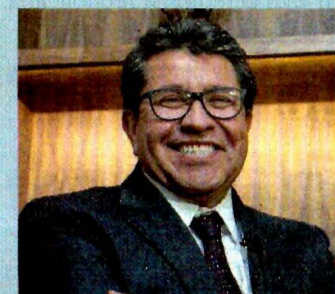
Ricardo Monreal destaca por ser un negociador político.