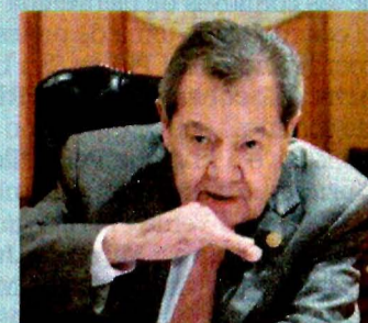
Porfirio Muñoz Ledo es de los políticos con más experiencia.

● Estos legisladores de Morena son clave para que Andrés Manuel López Obrador eche a andar la Cuarta Transformación desde la Cámara de Diputados y el Senado. A8