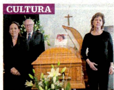
JUAN CARLOS REYES, EL UNIVERSAL