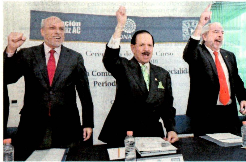
LUCÍA GONZÁLEZ, EL UNIVERSAL

El rector de la UNAM pide hacerlo a partir del 2 de julio, tras la violencia y desinformación en el proceso electoral, durante la ceremonia de fin de cursos de la Maestría en Comunicación con Especialidad en Periodismo Científico, impulsada por la Fundación Ealy Ortiz. A10