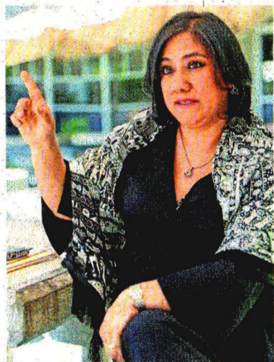
LUCÍA GONZÁLEZ/EL UNIVERSAL

“No. Nosotros no compartimos esa retórica bravucona (...) No vamos a andar anunciando lo de [ir contra] los peces gordos, sino más bien a poner en orden la casa”