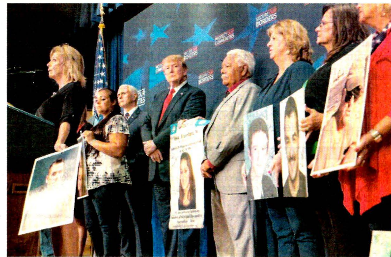
El presidente Donald Trump, en un acto en Washington con estadounidenses cuyos hijos murieron supuestamente a manos de indocumentados.