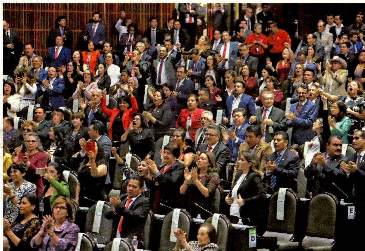
Senadores y diputados participaron en la apertura de la 64 Legislatura del Congreso de la Unión, una ceremonia marcada por la confrontación entre el partido mayoritario, Morena, y sus adversarios.

HORACIO JIMÉNEZ —politica@eluniversal.com.mx