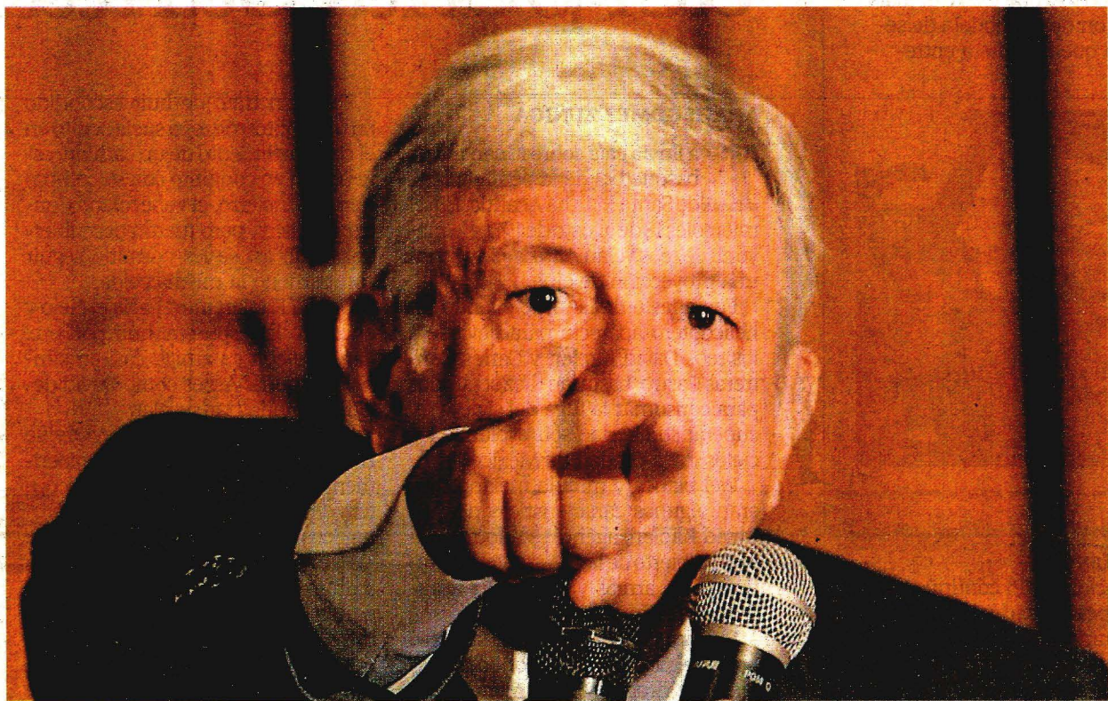
López Obrador dijo que a partir del lunes el dictamen técnico del nuevo aeropuerto se entregará al presidente Enrique Peña Nieto y también a ingenieros, expertos, empresarios y otros interesados para que sea analizado.

El presidente electo y su equipo técnico encabezado por el futuro titular de la Secretaría de Comunicaciones y Transportes, Javier Jiménez Espriú, detallaron los pros y contras de los proyectos, entre ellos, que el nuevo aeropuerto en Texcoco sería más oneroso y con un retraso de cuatro años en la construcción, pero cancelar la obra tendría un costo de al menos 170 mil millones de pesos: 100 mil millones por suspender los trabajos y el resto por habilitar dos pistas en Santa Lucía.